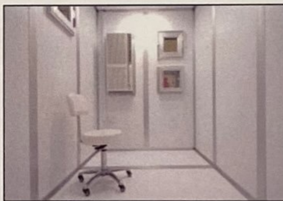
冷暖エアコン(奥左)

今回問題の新型コロナウイルスの大きさは、国立感染症研究所NIDの資料によると約 100\mu\text{m} 。主室内の空気は、このフィルターを通して外に排気されますので、新型コロナウイルス等の汚染物質を決して外に漏らすことは有りません。